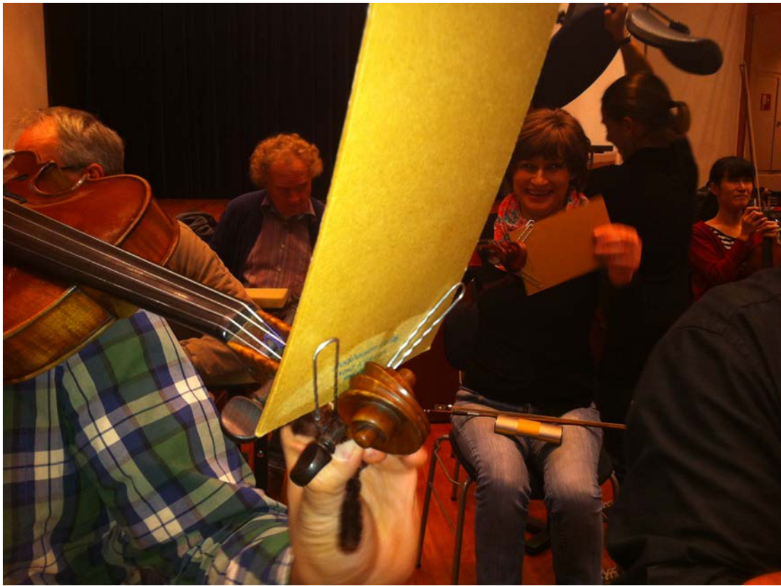
(für Violinen und Bratschen)