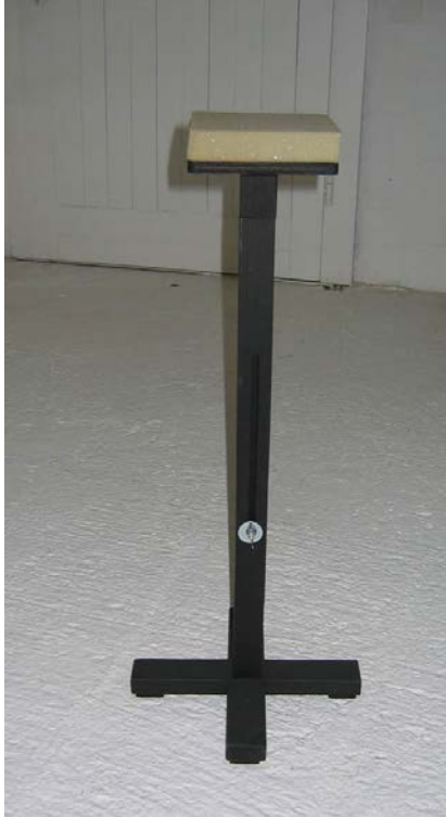
Holzständer, in der Höhe verstellbar, mit Auflage aus Schaumstoff

Holzständer , die als Armstützen für die Spieler der Violinen und Bratschen verwendet werden, müssen entweder gebaut oder beim Stockhausen-Verlag geliehen werden: